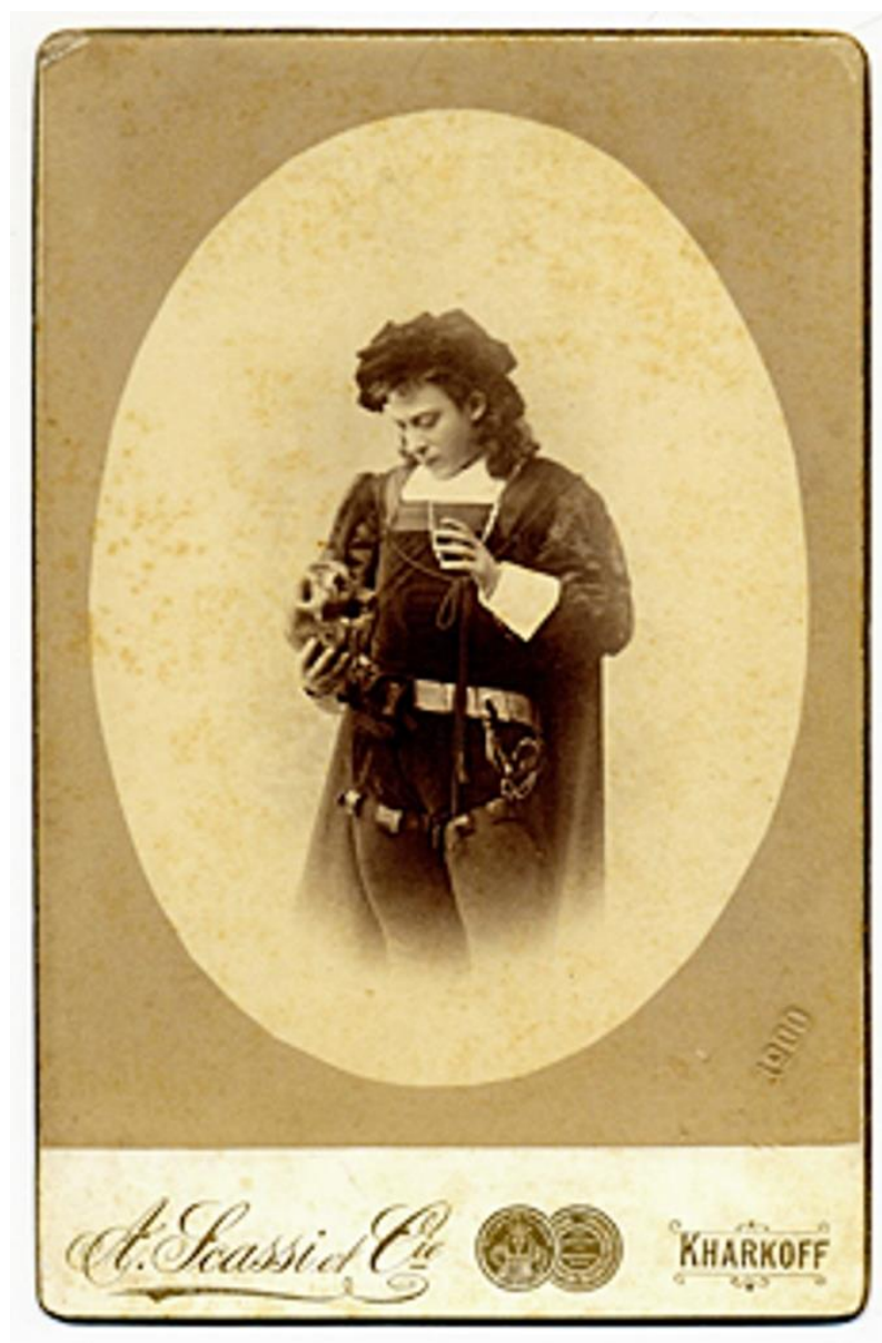
Фото: Павел Самойлов в роли Гамлета, 1911 год

Художник и актер могли встречаться при подготовке театральных постановок. В конце XIX века в Павловске, дачной местности под Петербургом, летом действовал театр, где выступал П.В. Самойлов и работал И.Е. Крачковский.