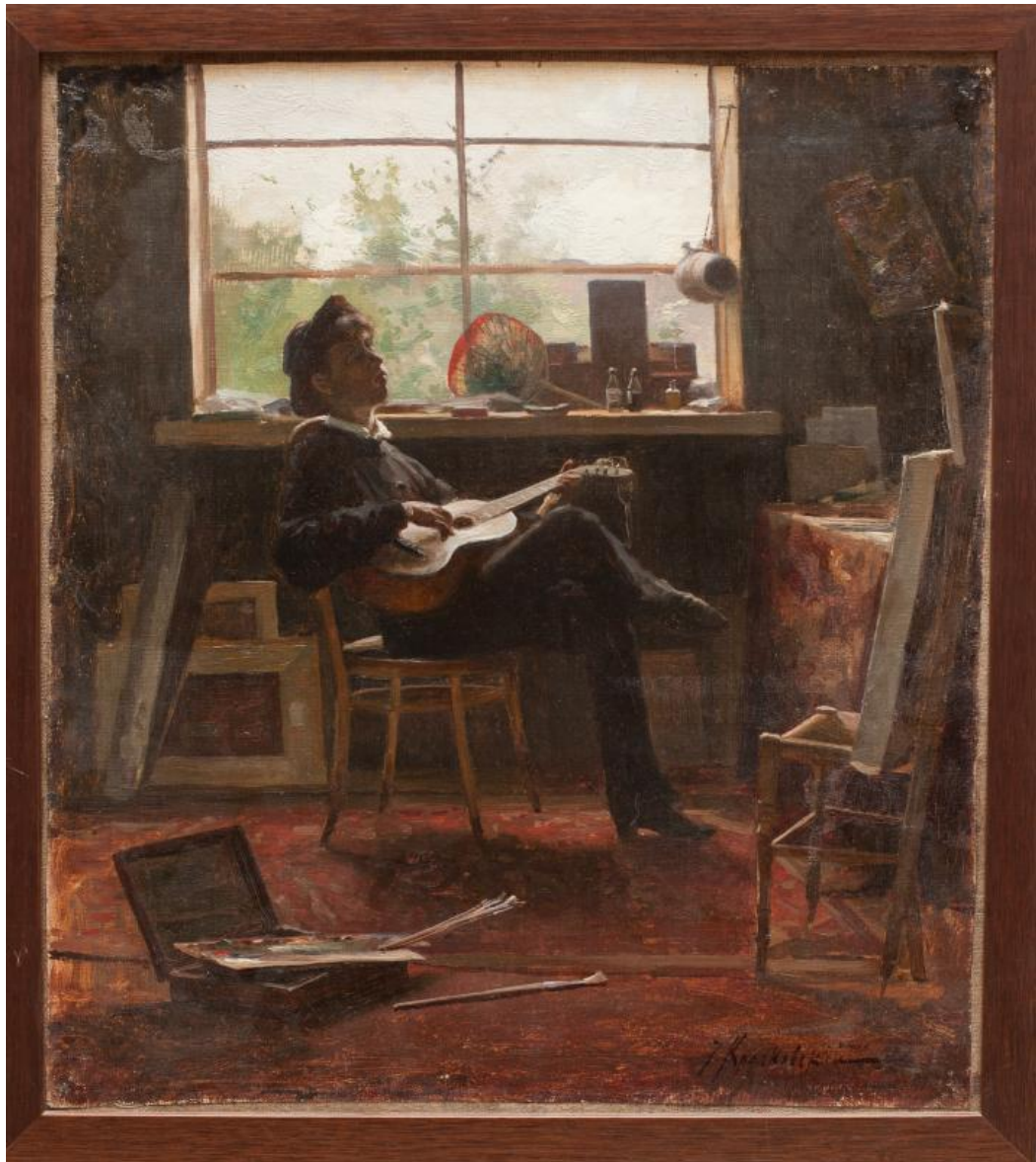
И.Е. Крачковский "Портрет Павла Самойлова в юности" Музей Самойловых, С-Петербург

Фотография с этой картины была опубликована в журнале "Нива" № 34 в 1911 году, когда проходила выставка картин "Товарищества художников" в Санкт-Петербурге. xii Художник показывает актера П.В. Самойлова в роли Гамлета. Имеется фотография того времени, которая показывает тот же образ актера. xiii