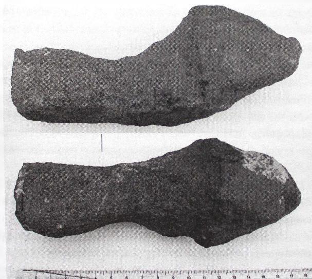
Рис. 2 Фаллический камень с ул. Мельничной в Плесе.

Фаллические камни, антропоморфные и неантропоморфные, аналогичные рассматриваемым нами, можно увидеть на разных континентах и у разных народов. Чем объясняется столь широкое их распространение? На наш взгляд, только тем, что фаллический культ являлся составной частью пришедшего всем родовым обществам культа предков.