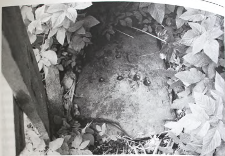
Рис. 3 Камень-«чашечник» (с участка ул. Ленина, д. 26)

курганных захоронениях, совершенных по славянскому обычаю, сопровождаемых мерянскими шумящими подвесками и славянскими височными кольцами в одном и том же захоронении (погребение 3, курганная группа Плес 2) 28 .