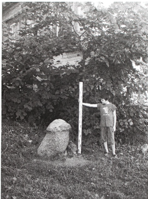
Рис. 1 Фаллический культовый камень на ул. Ленина в г. Плесе.

серого оттенка. Несколько отличается по цвету только сама «шляпка». Она более тёмная, имеет охристо-бурый оттенок. Из свидетельств жителей известно, что «шляпку» камня в 1990-е годы подкрашивали. Но может иметь место и использование при изготовлении изваяния природной особенности кварцитового валуна-заготовки, имевшего слоистое включение другого оттенка. Окончательные выводы можно будет сделать только после очистки поверхности от поздней краски. Поверхность «шляпки» несет следы полирования, нельзя исключать, что эти следы появились в ходе использования камня в некоей сакральной обрядности. Данный объект как древний культовый камень был ранее упомянут в статьях С.Б. Чернецовой 3 .