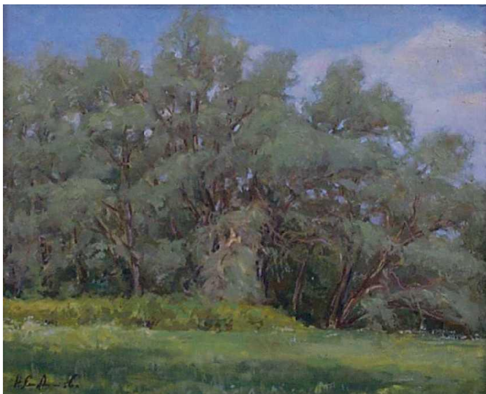
Купы ив. 1956, х.м. 39x48 (Плесский музей-заповедник, ж-148)