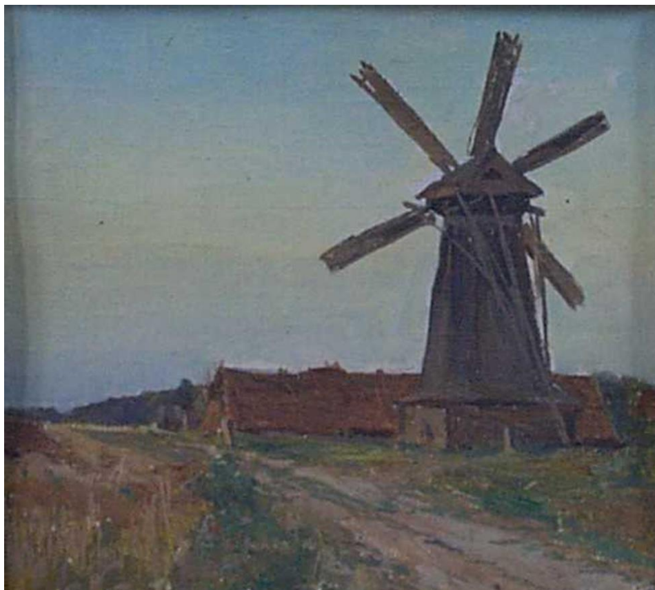
Ветряк. 1934. Х.м. (Плесский музей-заповедник, ж-170)