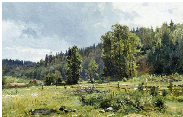
Квест-экскурсия по Музею пейзажа

Музейные квесты – популярный формат знакомства ребенка с искусством. Мы разработали данный маршрут с заданиями, которые помогут родителям превратить посещение музея в настоящее приключение и привить ребенку любовь к изобразительному искусству. Наш квест подходит как для самостоятельного прохождения ребенком, так и в компании друзей. Скачайте квест, распечатайте и возьмите с собой в музей. По окончании квеста проверьте правильность ответов.