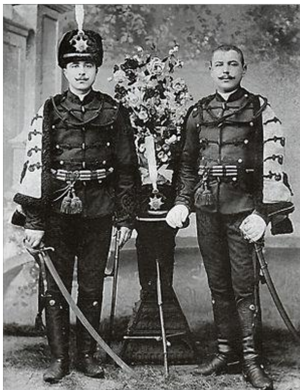
Нижние чины Лейб-гвардии Гусарского полка в парадном обмундировании в 1910-е гг.

Причастность военнослужащих к данному формированию навела на мысль о целесообразности просмотра материала по истории данного полка. Часы были подарены, согласно гравированной надписи и номеру их изготовления, в 1899-1900 гг. В этот период полк не принимал участия ни в каких военных действиях и был расквартирован в Царском селе. Живописный комплекс казарм лейб-гвардии Гусарского ЕИВ полка занимал пространство между Госпитальной и Огородной улицами (ныне: г. Пушкин, Парковая ул., 38-54). Казармы первых четырех эскадронов между Госпитальной и Гусарской улицами в 1889-1892 гг. перестроили и дополнили отдельно стоящими флигелями для семейных чинов, по одному на каждый эскадрон. Компактные строгие объемы казарм образуют архитектурный ансамбль в формах эклектики с элементами кирпичного стиля.