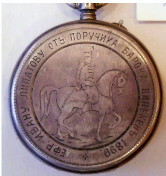
Наградные часы фирмы «Павел Буре» 1899-1900 гг. (серебро, гравировка, гильошировка, эмаль, стекло) Плесский музей-заповедник