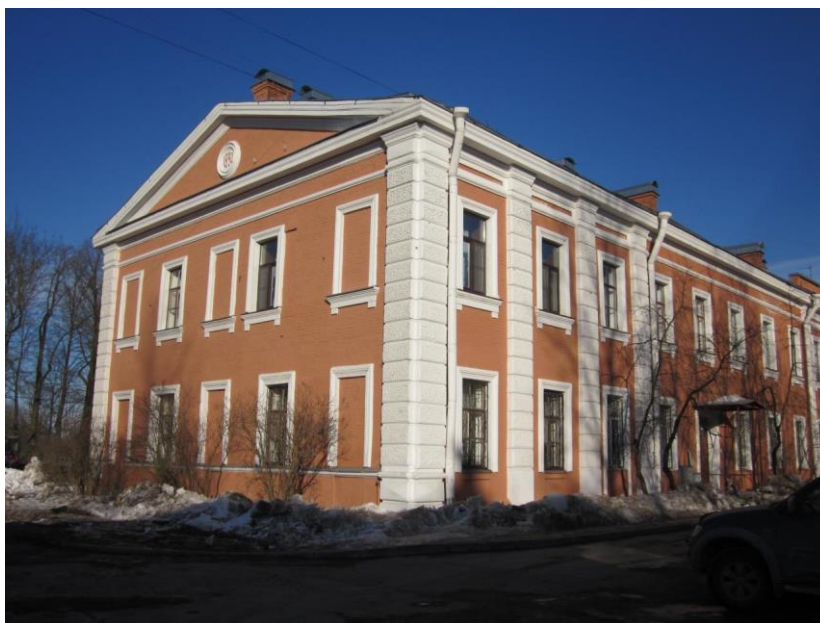
г. Пушкин, ул. Парковая, 44 к.2

Лейб-гвардии гусарский Его Величества полк был старейшим полком, размещенным в Царском Селе. Свою историю он ведет с 1782 года, когда наследник цесаревич Павел, из своих флотских батальонов составил две конные команды по 30 человек каждая. Гусар отличала особая форма одежды, состоящая из доломана - куртки со стоячим воротником и шнурами, ментика - короткой куртки с мехом, кивера или меховой шапки с султаном, рейтузов, расшитых шнурами и низких сапог со шпорами. В конце 1800 года лейб-гвардии гусарский полк был размещен в окрестностях Царского Села: Софии, Павловске, Пулково и Кузьмине. Совместно с конной гвардией лейб-гусары составляли царскосельский гарнизон. Боевое крещение полк получил в 1805 году, в бою под Аустерлицем, участвовал в сражениях Отечественной войны 1812 года. В этом полку с 1834 по 1840 год служил корнетом поэт Михаил Лермонтов, Денис Давыдов (с 1806), Петр Чаадаев (1817-1821), Н.Н.Раевский и др. В разные годы полком командовали: генерал-майор Хомутов, барон Мейендорф, граф Воронцов-Дашков, Великий князь Николай Николаевич, князь Васильчиков, генерал Воейков. 4 марта 1917 года полк был переименован в лейб-гвардии Гусарский полк, 8 мая 1918 года расформирован.