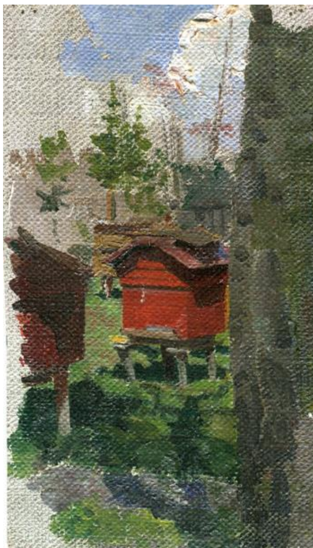
Серафим Зверев. Ульи. 1931 г. х.м. 14.6x7.7

Среди копий рисунков и репродукций живописных работ художника Серафима Зверева (1912-1979) есть крохотный этюд «Ульи» (х.м. 14.6x7.7, 1931).