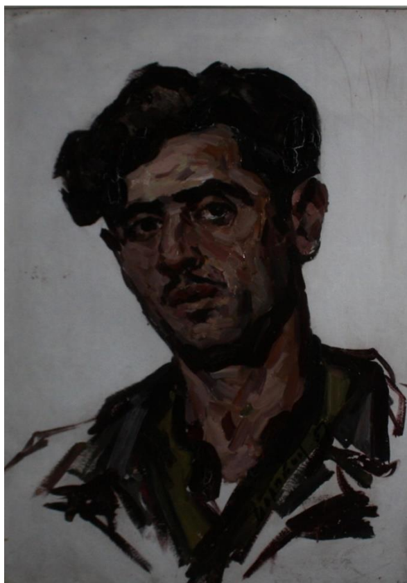
М.И. Малютин. Бульдозерист. 1957, К., м., 50x35, ПГИАХМЗ